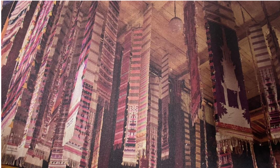
ตุ่งที่ชาวบ้านนำมาถวายวัดท่าฟ้าใต้ จังหวัดพะเยา

- ตุ่งขาววา คำว่า ชาว แปลว่า ยี่สิบ ดังนั้นคำว่า ตุ่งขาววา คือ ตุ่งที่ยาว 20 วา โดยตุ่งชนิดนี้จะมีลักษณะเหมือนตุ่งไชย แต่ต่างกันตุ่งขาววาจะมีความยาวมากกว่า โดยทั่วไปตุ่งชนิดนี้จะเป็นตุ่งผ้าสีขาวยาวประมาณ 6 - 7 เมตร ไม่ถึงขาว หรือ 40 เมตร โดยห้อยแขวนอยู่บนเสาไม้ที่ปักอยู่บริเวณหน้าวัด