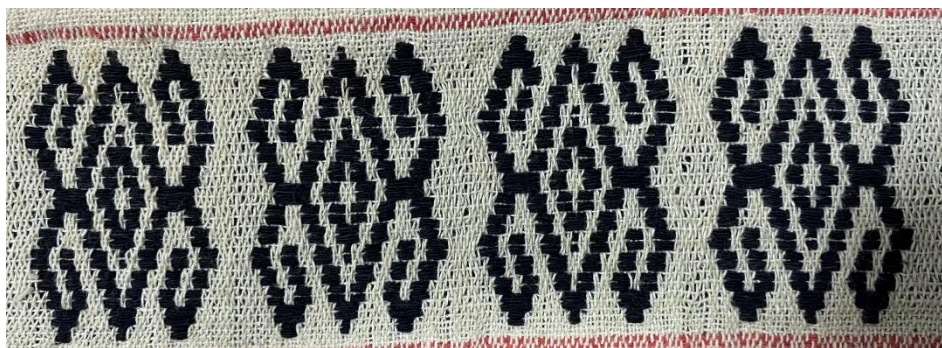
ลายดอกเงาะ