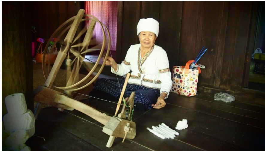
ชาวไทลื้อบ้านหลวงเหนือ อำเภอสันกำแพง จังหวัดเชียงใหม่

1. จังหวัดเชียงใหม่ อยู่ที่บ้านเมืองหลวง ตำบลหลวงเหนือ อำเภอต๋อยสะเก็ด เป็นชาวไทลื้อที่เข้ามาเป็นรุ่นแรก ๆ ราวพุทธศตวรรษที่ 18 ในสมัยพระเจ้าสามฝั่งแกน ส่วนรุ่นหลัง เช่น ที่บ้านแม่สาบ อำเภอสะเมิง อำเภอสันกำแพง อำเภอสันทราย และอำเภอแม่ออน โดยชาวไทลื้อที่บ้านเมืองหลวง อำเภอต๋อยสะเก็ด และบ้านแม่สาบ อำเภอสะเมิง จะเป็นกลุ่มชาวไทลื้อที่อพยพมาจากสิบสองปันนา ส่วนที่บ้านสันกำแพง อำเภอสันกำแพง เป็นกลุ่มชาวไทลื้อที่มาจากเมืองเชียงตุง รัฐฉาน ประเทศพม่า และเรียกตัวเองว่า คนเขิน