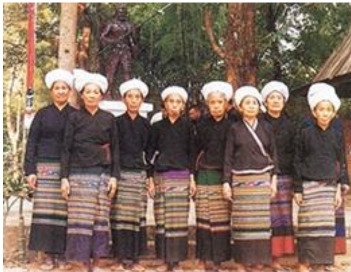
ชาวไทลื้อ อำเภอเชียงคำ จังหวัดพะเยา

5. จังหวัดน่าน มีหมู่บ้านไทลื้ออยู่ทั่วไปในเขตอำเภอเมือง อำเภอท่าวังผา อำเภอปัว อำเภอเชียงกวาง อำเภอทุ่งช้าง และอำเภอแม่จริม