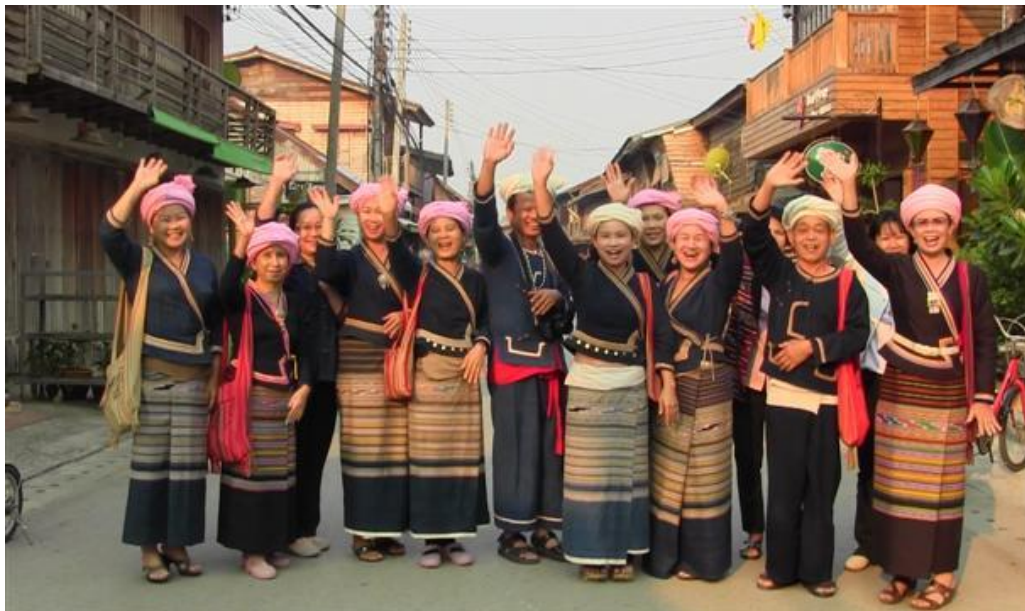
การแต่งกายของชาวไทลื้ออำเภอเชียงคำ จังหวัดพะเยา