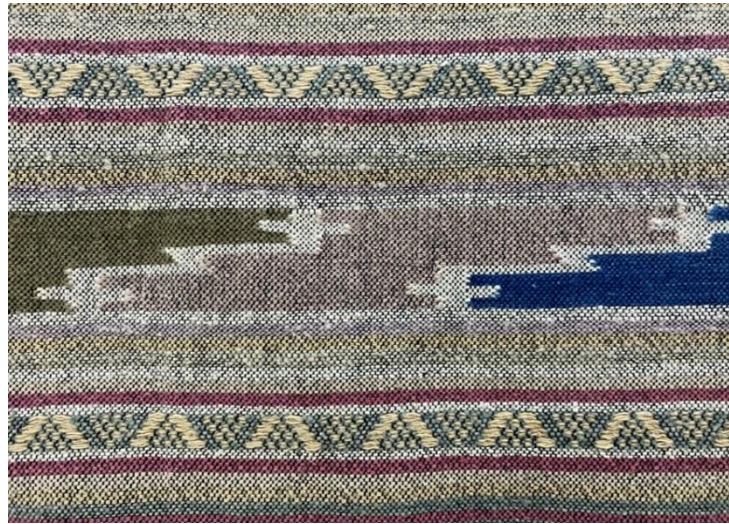
ลายผักแว่น บนตัวซิ่นไทลื้ออำเภอเชียงคำ จังหวัดพะเยา