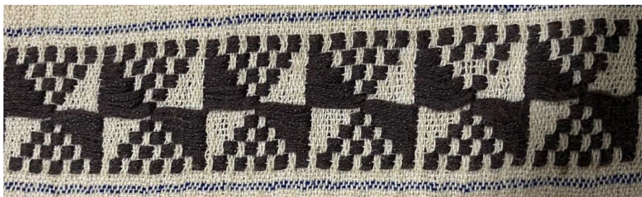
ลายดอกแหลมผิต

4. ลวดลายผ้าในพิธีกรรม บางลายจะมีชื่อเรียกเฉพาะ เช่น เขี้ยวหมา จี๊ดอกเปา เขี้ยวหมาสำกระแจ้สำ แหลมผิต เป็นต้น ลวดลายเหล่านี้บางครั้งจะเก็บเอาภาพสิ่งของเครื่องใช้และพิธีกรรมเก่าแก่ไว้ด้วย เช่น